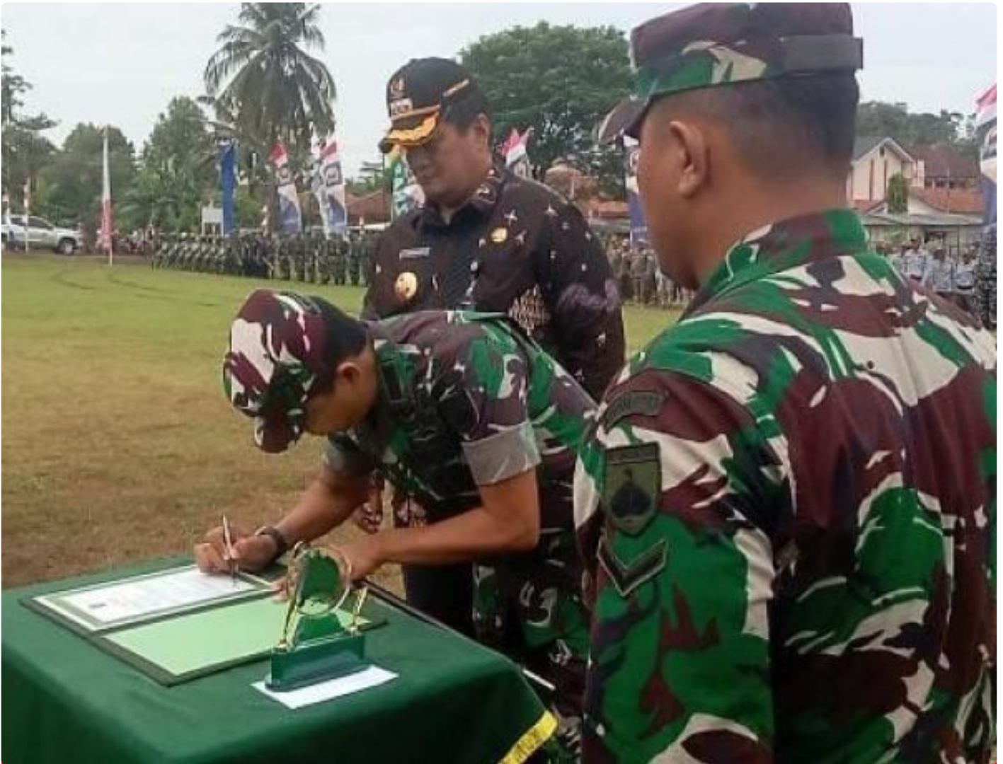
TMMD Kodim 0703/Cilacap di Desa Bojong, Jembatan Percepatan Pembangunan dan Pemberdayaan Masyarakat

CILACAP - TMMD Sengkuyung Tahap I Kodim 0703/Cilacap tahun 2025 di Desa Bojong, Kecamatan Kawunganten, Kabupaten Cilacap telah resmi dibuka oleh Pj.